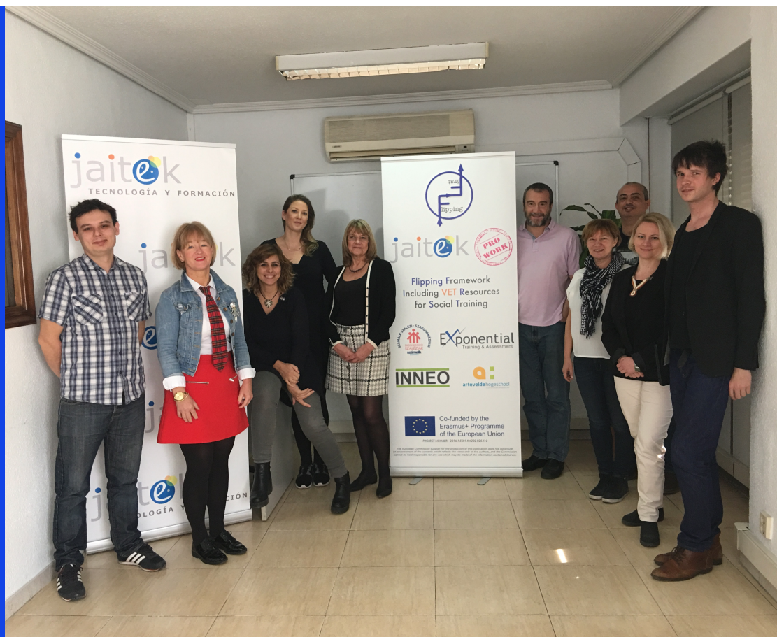
Eredményes tanár tréning Madridban. Flipping eszközök használata és a módszertanok kidolgozása